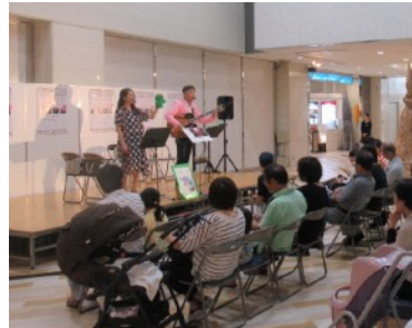
デパートの特設ステージでの子どものためのジャズライブ