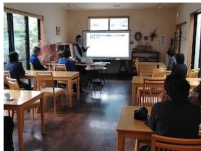
カフェを会場にトークイベントを開催