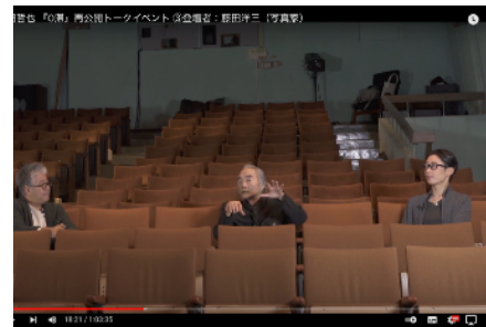
トークイベントをYouTubeにて配信