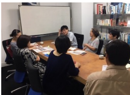
『ベップ・アート・マンスをつくろう会』の様子