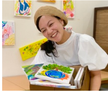
日ごろ描きためた絵の展示