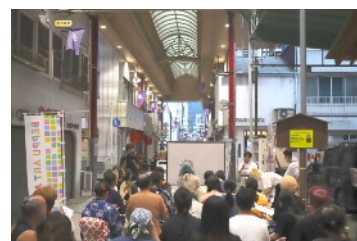
『バム・ジャンボリー!』の様子