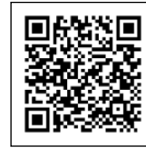
登録申請フォーム

① プログラム登録申請書の提出 4/25(金)～6/2(月) ※ヒアリング予約も同時に行います。