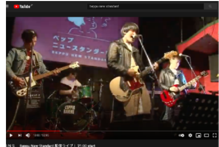
音楽ライブの生配信