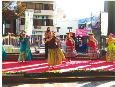
子どもから大人まで幅広い世代がダンスを披露