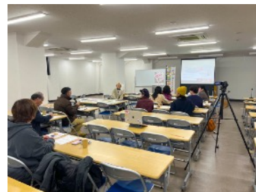
報告会&交流会の様子