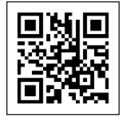
ヒアリング 予約フォーム