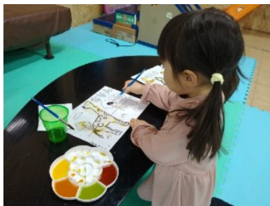
野菜で絵の具を作って楽しくお絵かき