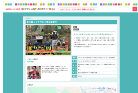
Webサイトでのプログラム紹介 (写真は2024年度版)