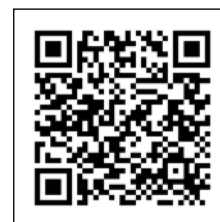
プログラム 登録申請フォーム

登録申請書を記入し、メール、郵送、または持参にて 事務局までご提出ください。 手書きの場合は、はっきりと読みやすくご記入ください。