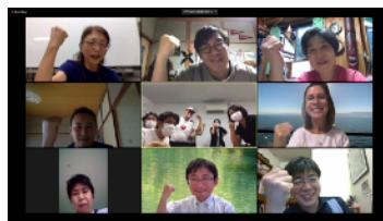
つくろう会の様子