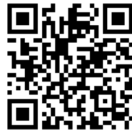
登録専用フォーム

【締め切り】 2024年5月31日(金) 必着 事務局へご持参の場合は、17:00 までをお願いします。