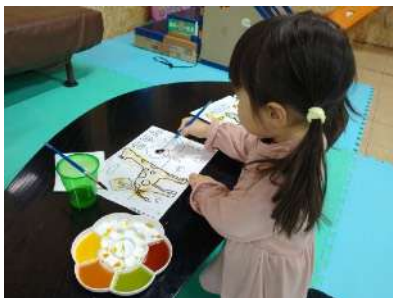
野菜で絵の具を作って楽しくお絵かき