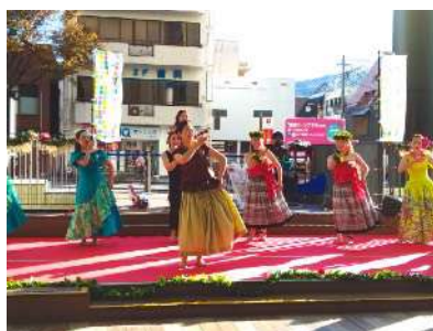
子どもから大人まで幅広い世代がダンスを披露