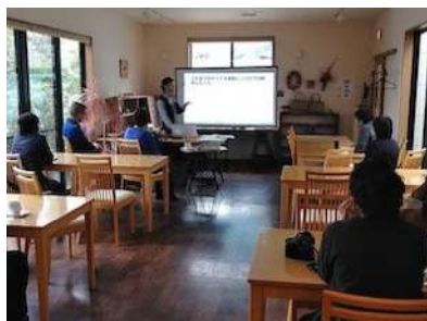
カフェを会場にトークイベントを開催