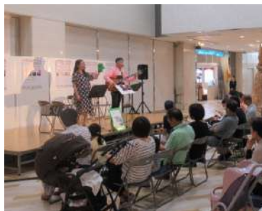
デパートの特設ステージでの子どものためのジャズライブ