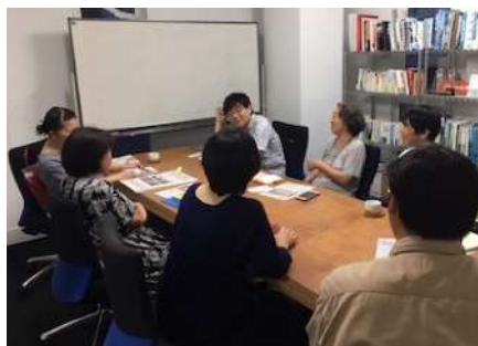
『ベップ・アート・マンスをつくろう会』の様子

オンラインイベントに関するサポートについては、別紙2『オンライン上でのプログラム実施に関するサポート』をご覧ください。