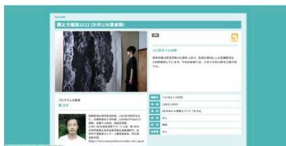
Webサイトでのプログラム紹介（写真は2022年度版）