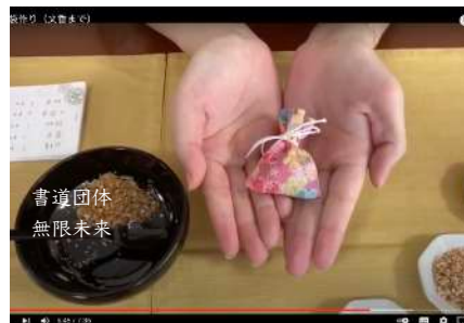
オリジナルの匂い袋の作り方をyoutubeで公開