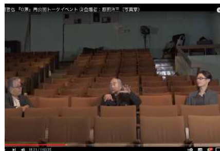
トークイベントをYouTubeにて配信