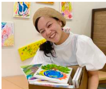
日ごろ描きためた絵の展示