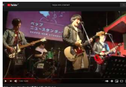
音楽ライブの生配信